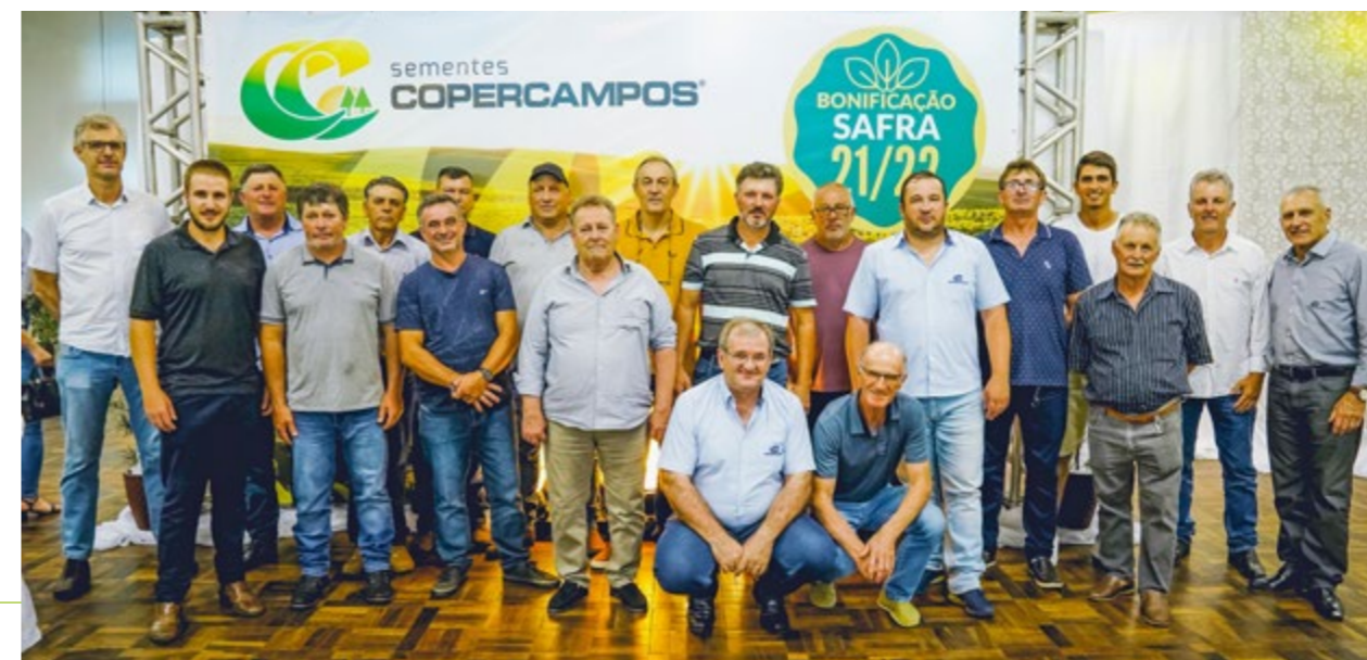
Ganhadores da pescaria