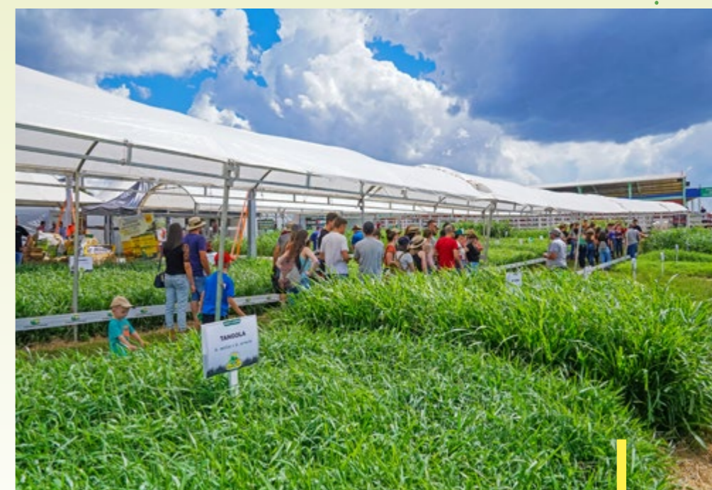
Vitrine de pastagens atrai pecuaristas da região

O melhoramento de pastagens é constante e a equipe da Copercampos está atenta as novidades para que você visitante possa ter um aumento no potencial produtivo de sua fazenda. Programe-se e participe da 27ª edição do Show Tecnológico Copercampos, que acontece de 14 a 16 de fevereiro, em Campos Novos/SC. O evento é gratuito e reúne empresas de todos os segmentos do universo agropecuário.