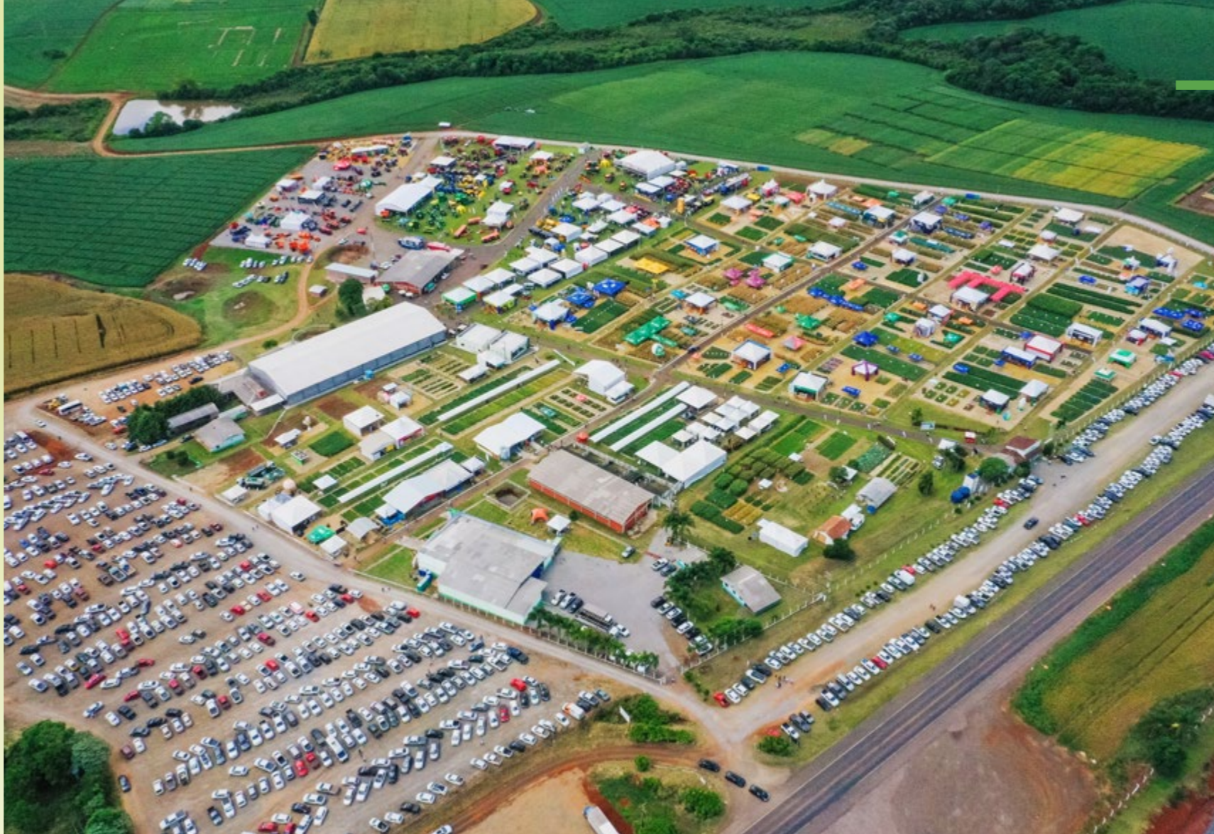
Imagem do 26º Show Tecnológico (2022)

São três dias para você renovar conhecimentos, trocar experiências e desfrutar do maior e mais completo