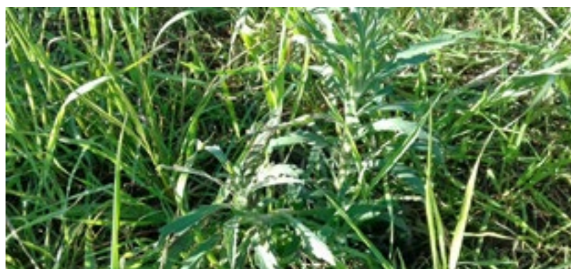
Planta de buva em meio a pastagem de inverno.