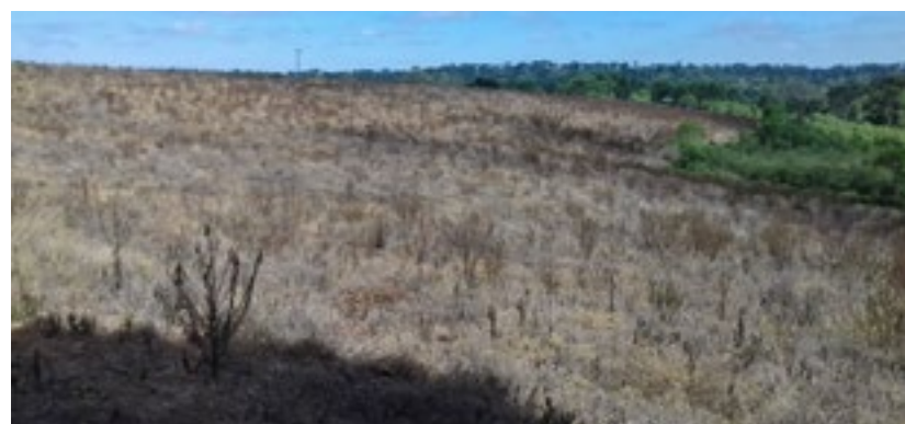
Área de pousio manejada com 2,4 –D + clethodim + glifosato + diclosulam, aplicação única.