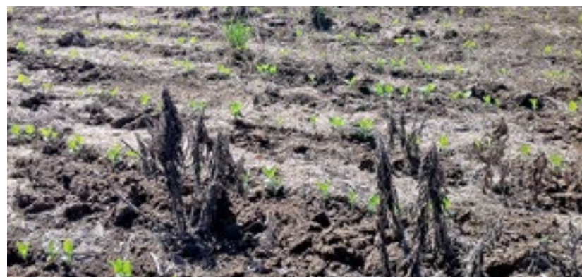
Manejo buva pré-semeadura com aplicação sequencial de paraquat seguido de diclosulam + glifosato

Nenhum método deve ser aplicado isolado, mas em conjunto. Mais do que nunca devemos juntar esforços e implementar as técnicas de forma organizada e específicas para cada situação. O Departamento Técnico da Copercampos detém o conhecimento necessário e está empenhado em garantir que seus produtores desfrutem dos melhores métodos de controle, controle, a fim de obter o máximo potencial de suas lavouras.