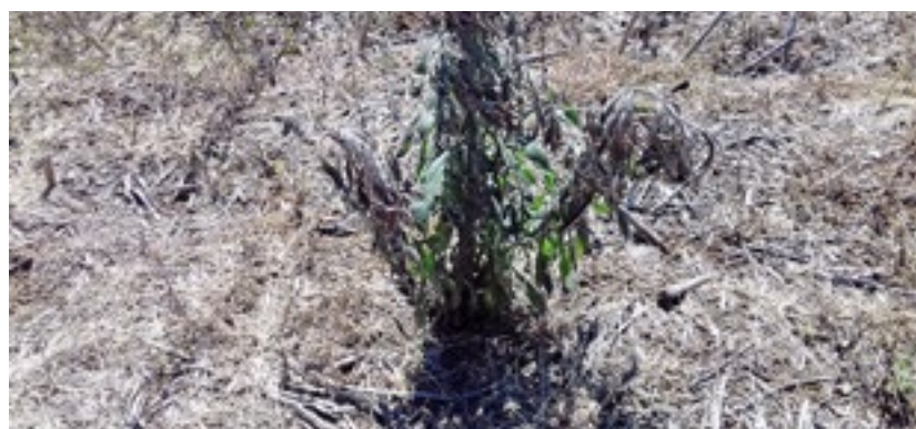
Dessecação buva pré-semeadura com aplicação sequencial de 2,4 – D seguido de saflufenacil + glifosato