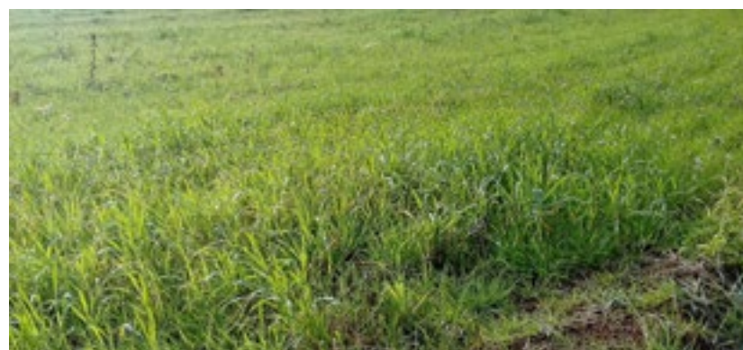
Área manejada com cobertura de aveia.