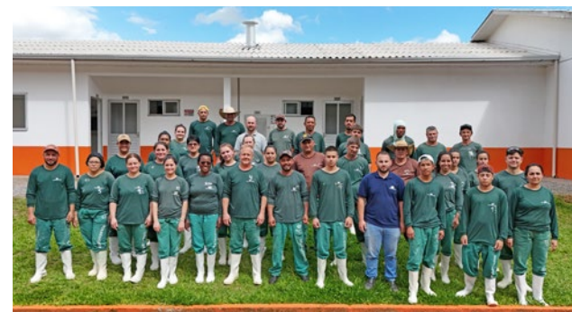
Funcionários do Núcleo de Ovos

Mais do que um projeto, o Copertalentos se tornou uma filosofia de gestão: a certeza de que investir nas pessoas é a estratégia mais inteligente para construir equipes fortes, ambientes saudáveis e resultados sustentáveis. A Agroindústria Copercampos sai deste ciclo mais preparada, mais humana e mais alinhada com os desafios do futuro. Fortalecer pessoas é fortalecer a cooperativa. E os frutos dessa escolha já estão sendo colhidos em cada unidade, todos os dias.