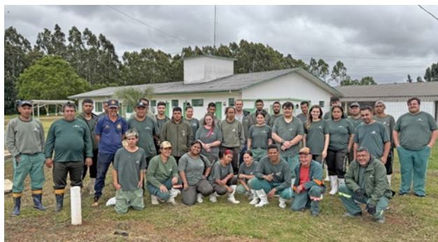
Funcionários da Granja dos Pinheiros