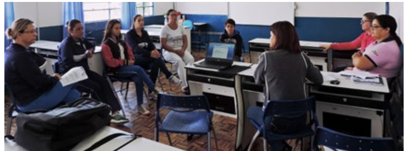
Escola Municipal de Ensino Fundamental Santa Júlia Billiard

Participaram da avaliação as escolas: Escola Isolada Municipal Encruzilhada, Escola Municipal de Ensino Fundamental Novos Campos, Escola Municipal de Ensino Fundamental Santa Júlia Billiard, Grupo Escolar Municipal Deputado Waldemar Rupp e Grupo Escolar Municipal Jardim Bela Vista.