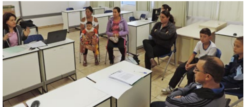
Grupo Escolar Municipal Deputado Waldemar Rupp