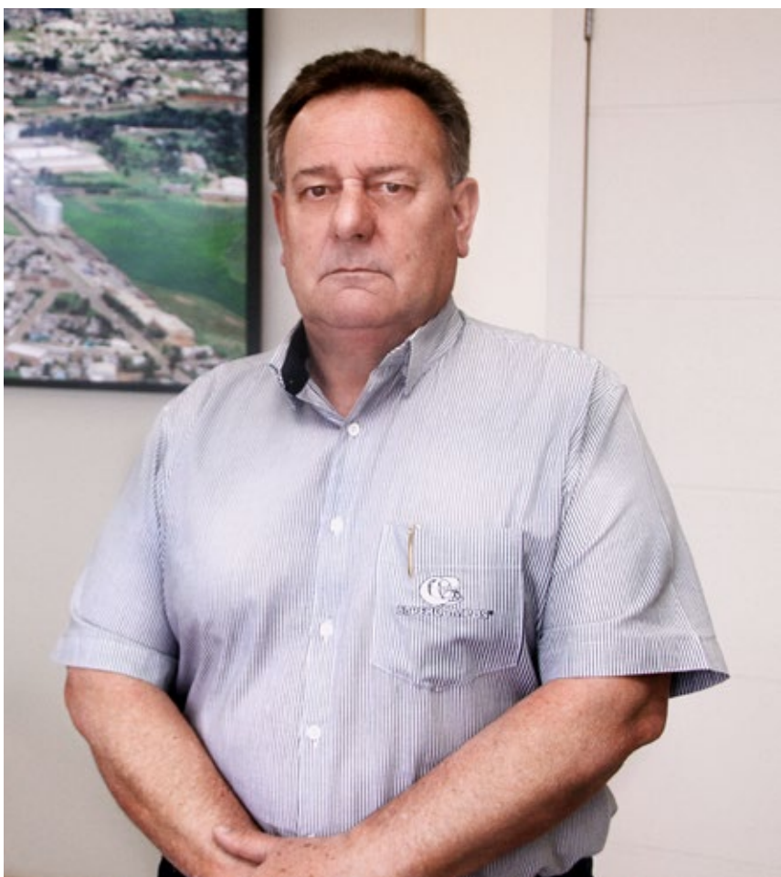
Por: Luiz Carlos Chiocca, Diretor Presidente

Iniciamos a colheita de mais uma safra, que graças a dedicação e compromisso dos produtores, juntamente com a boa condição climática deste ano, proporcionaram uma excelente produção de grãos e também de semente. Ao longo deste mês e também no mês de março, pudemos observar a grande movimentação de caminhões carregados de soja e milho, que tomaram conta dos pátios da Copercampos na matriz e filiais, resultado do trabalho realizado nas lavouras, desde correção e fertilização do solo, emprego de sementes de ótima qualidade genética, além de tratamentos preventivos com a utilização de insumos de qualidade, todos esses fatores proporcionaram a está safra, um volume de produção histórico, com recorde de produtividade por hectare. E para garantir a qualidade vinda das lavouras, a Copercampos dispõe de mais de 30 unidades de recebimento de grãos e UBS's, devidamente equipadas para os melhores tratamentos e condições de armazenagem.