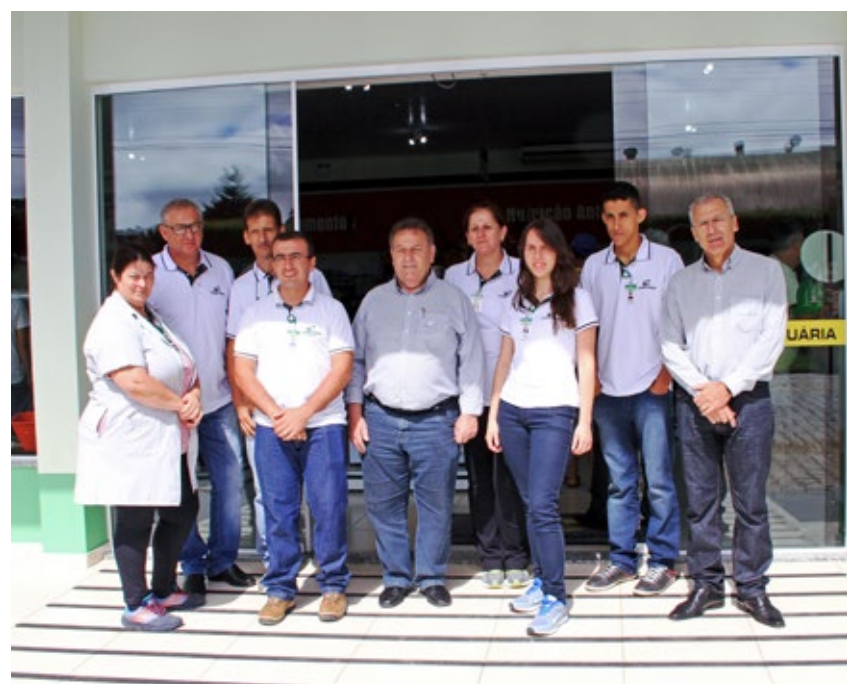
Diretores Presidente e Vice-presidente junto com funcionário da Unidade