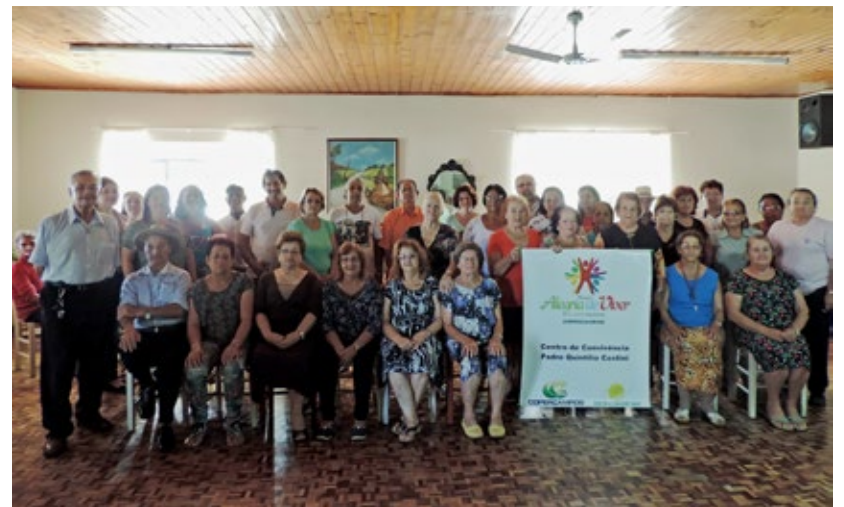
Centro de Convivência Pe. Quintilho Costini

Até o ano de 2016 eram atendidas em Campos Novos treze escolas municipais e cinco estaduais, este ano foram incluídos uma Invernada Artística, cinco Centros Educacionais Infantís de Campos Novos e uma escola de