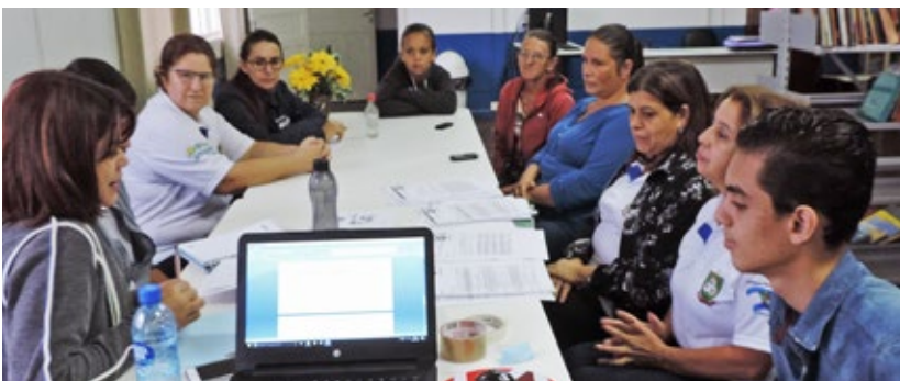
Escola Municipal de Ensino Fundamental Novos Campos