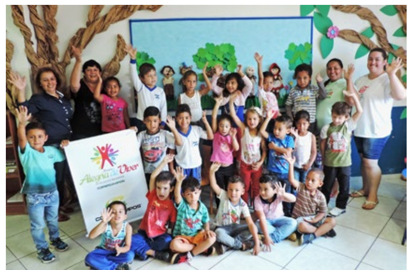
Escola Eliete Teixeira Lopes