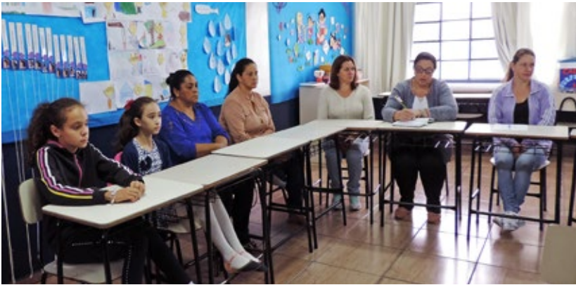
Grupo Escolar Municipal Jardim Bela Vista