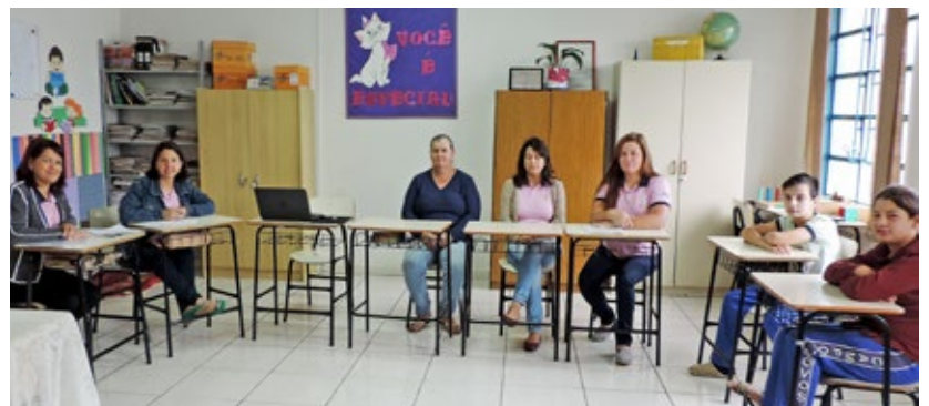
Escola Isolada Municipal Encruzilhada