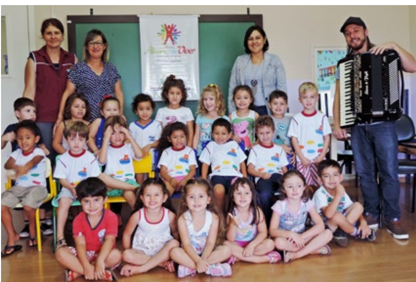
Escola Sonho Infantil