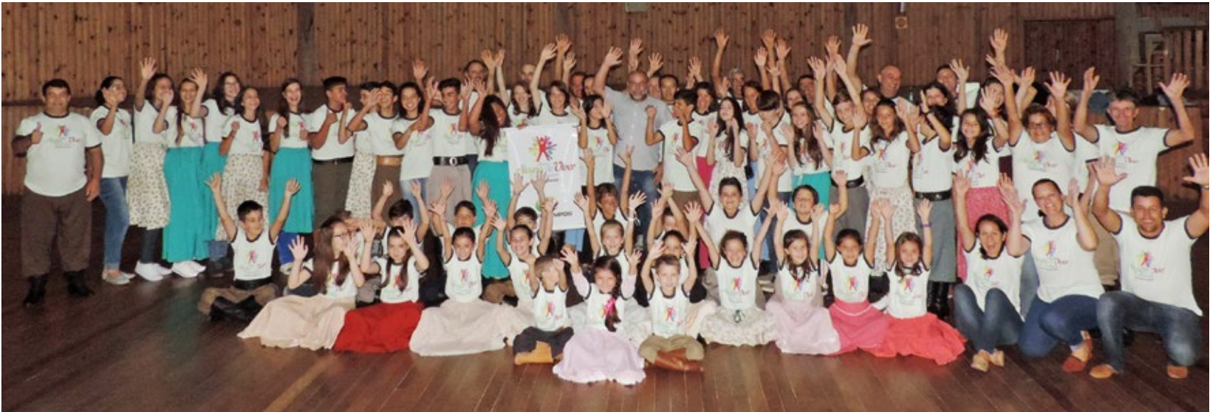
Invernada Artística Campos Novos

A partir do dia 1º de março deste ano a Copercampos reiniciou as oficinas do Projeto Social "Alegria de Viver – Revelando Talentos". Este ano a cooperativa é parceira em diversas entidades/escolas nos municípios de Campos Novos, Brunópolis, Campo Belo do Sul e Ituporanga.