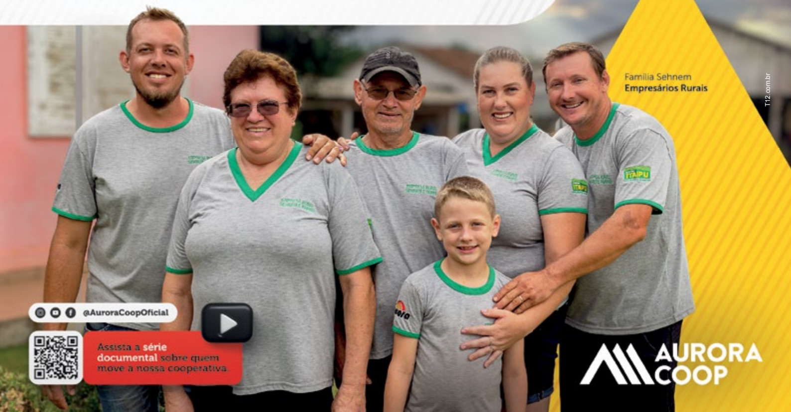
Família Sehnem Empresários Rurais

A Aurora Coop faz 54 anos e, juntos, vamos celebrar as pessoas que, com sua dedicação e respeito, fazem o nosso processo produtivo alcançar a excelência do início ao fim.