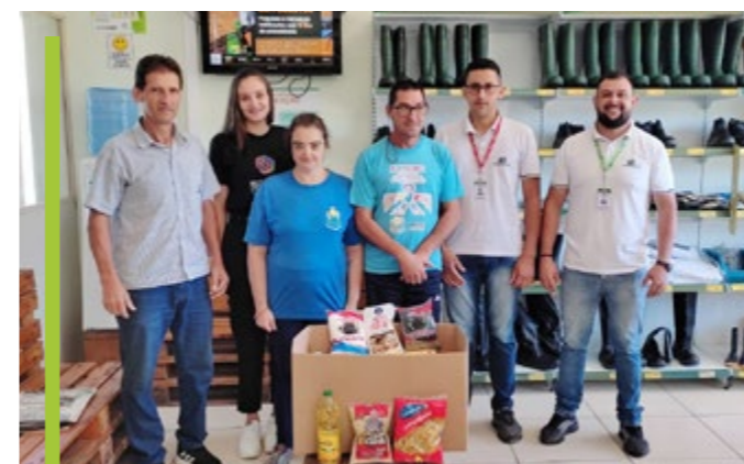
Entrega de doações para a APAE de Anita Garibaldi/SC

Ação “Segurança no campo para cuidar do nosso povo” busca proteger profissionais nas atividades agrícolas e ajudar comunidade.