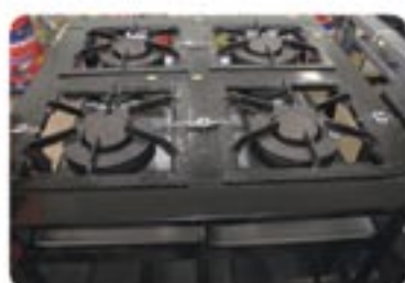
Discos e fogareiros em 3x sem juros