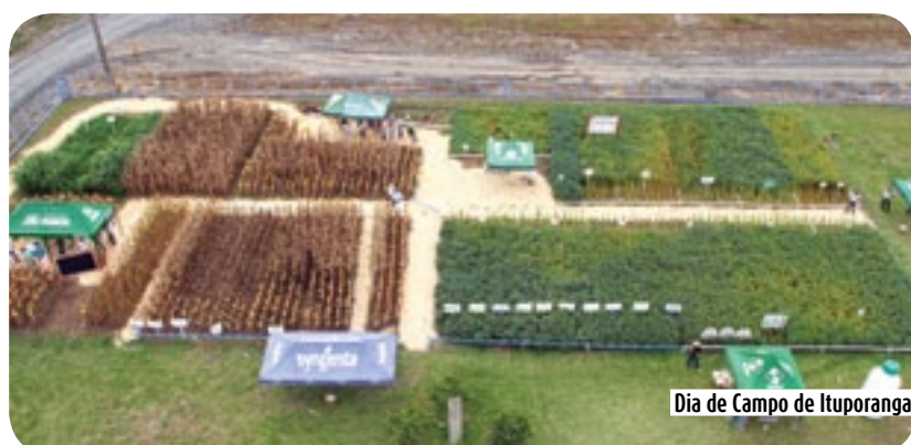
Dia de Campo de Ituporanga