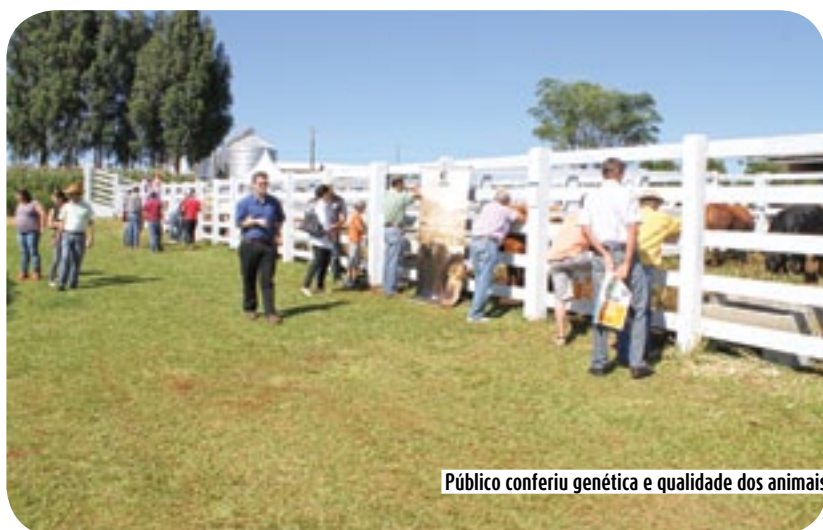
Público conferiu genética e qualidade dos animais

Na horta orgânica os visitantes conferiram a produção de alimentos com alta qualidade. A Epagri apresentou também a unidade móvel de extensão rural e a previsão do tempo on-line (Epagri/Ciram).