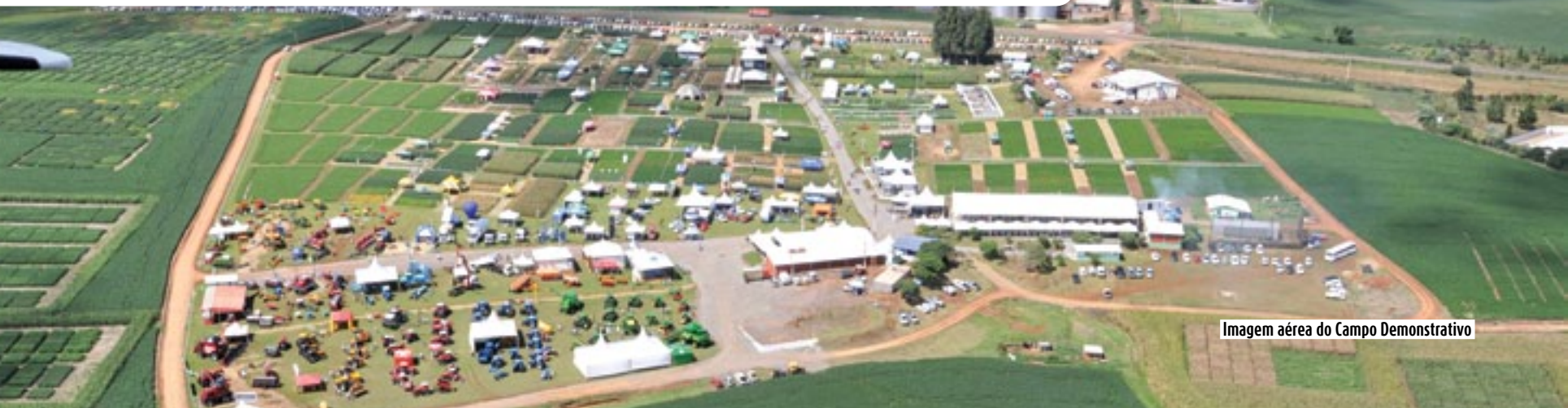
Imagem aérea do Campo Demonstrativo

Aproximadamente 11 mil profissionais do agronegócio estiveram presentes nos três dias de evento em Campos Novos. 19º Dia de Campo já tem data definida