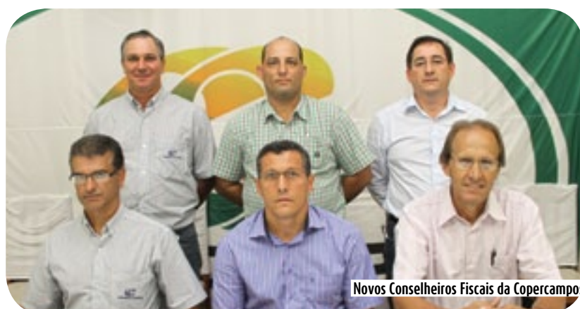
Novos Conselheiros Fiscais da Copercampos