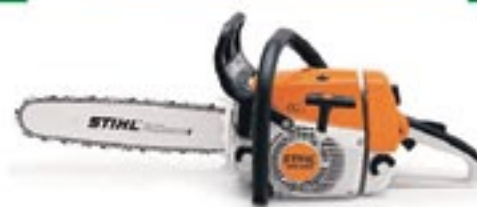
Motosserras Stihl em promoção!