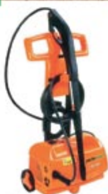
Diversas opções em Lava Jatos