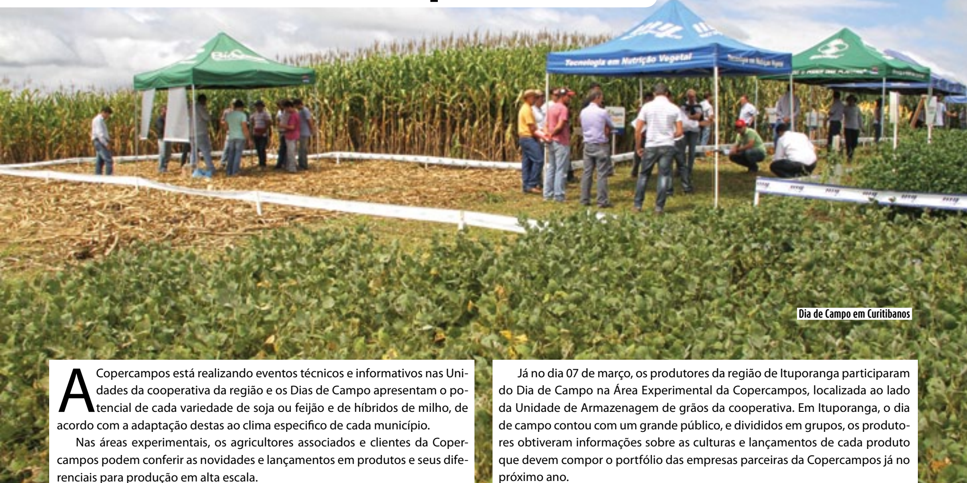
Dia de Campo em Curitiba

A Copercampos está realizando eventos técnicos e informativos nas Unidades da cooperativa da região e os Dias de Campo apresentam o potencial de cada variedade de soja ou feijão e de híbridos de milho, de acordo com a adaptação destas ao clima específico de cada município.