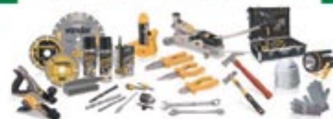
Toda linha de produtos Vonder Serra Tico-Tico; Macacos hidráulicos; Caixas de ferramentas e muito mais!