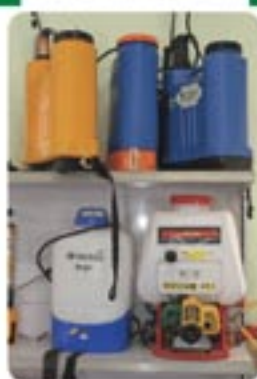
Pulverizadores costais a motor e manuais