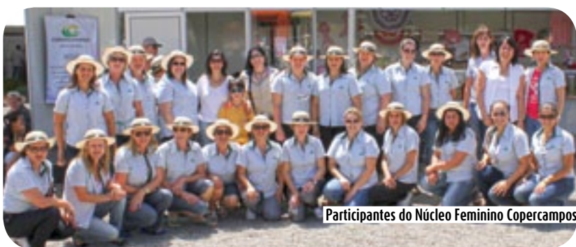
Participantes do Núcleo Feminino Copercampos

O Núcleo Feminino Copercampos participou do Dia de Campo Copercampos e apresentou um pouco do trabalho realizado pelo grupo. As mulheres, sócias e esposas de associados estiveram promovendo uma integração entre a família e debatendo sobre o que fazer para melhorar as empresas rurais.