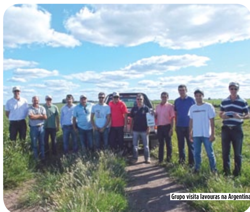
Grupo visita lavouras na Argentina

Você quer o melhor combustível ou lubrificante para o seu carro, caminhão ou máquina agrícola?