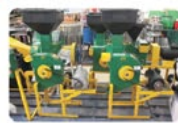
Toda linha de ferrageiras Maqtron

Para consulta de preços e prazos visite nossa loja e confira todos estes produtos e muitos outros.