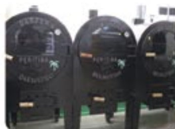
Fornos Darfer Peritiba Inox Tam: P/M/G