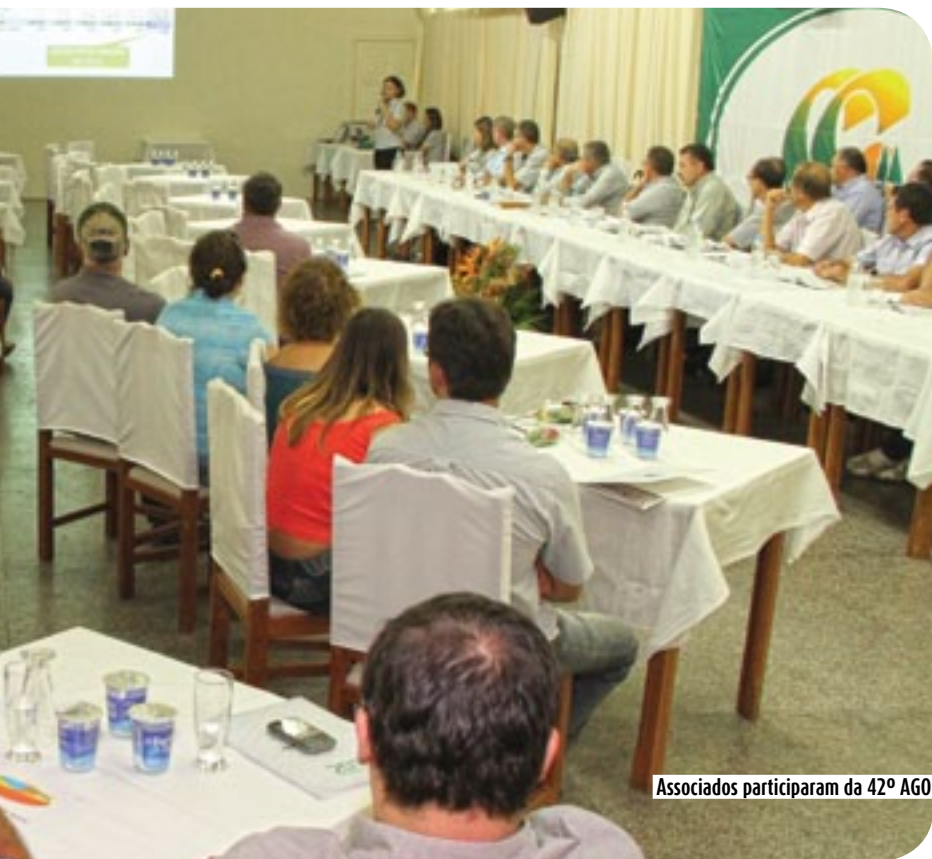
Associados participaram da 42ª AGO