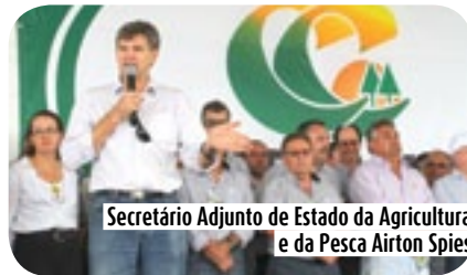
Secretário Adjunto de Estado da Agricultura e da Pesca Airton Spies

Para o prefeito Municipal de Campos Novos Nelson Cruz, o evento da Copercampos demonstra o que há de melhor no município considerado o Celeiro Catarinense. "O Dia de Campo Copercampos apresenta a tecnologia existente no agronegócio e principalmente, a preocupação da cooperativa em proporcionar conhecimento e consequentemente rentabilidade aos agricultores. O evento apresenta Campos Novos e todo o seu potencial no setor e nos orgulha muito poder participar deste evento", comentou o Prefeito Nelson Cruz.