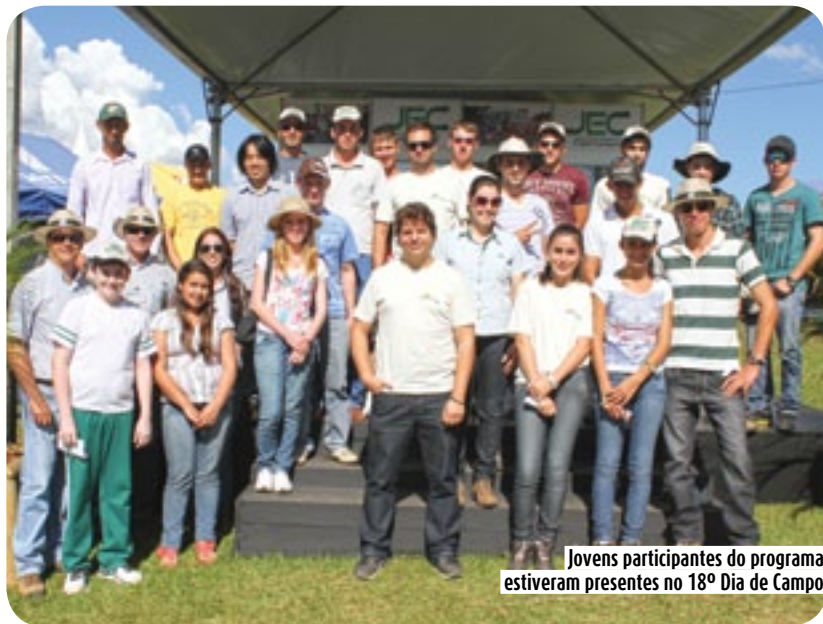
Jovens participantes do programa estiveram presentes no 18º Dia de Campo

No stand do JEC, o grupo se reuniu e se integrou ainda mais para que em 2013, novas ações de inclusão e conhecimento sejam realizadas. O grupo realizou uma reunião para definir quais atividades serão realizadas no ano, assim como a participação de feiras e exposições agrícolas que estes irão participar. O grupo já esteve participando neste mês de março da Expodireto 2013 – realizada em Não-Me-Toque, Rio Grande do Sul.