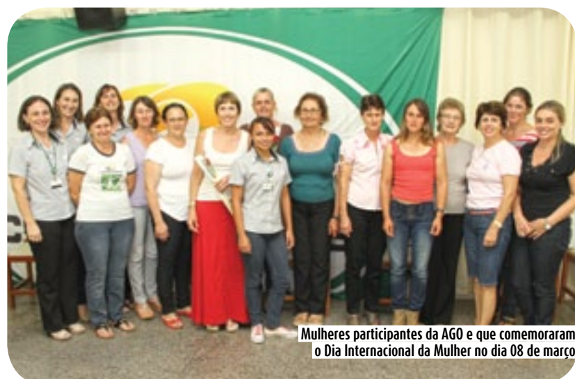
Mulheres participantes da AGO e que comemoraram o Dia Internacional da Mulher no dia 08 de março