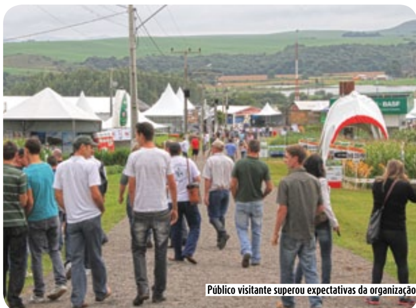
Público visitante superou expectativas da organização