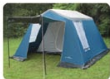
Vai acampar? Barracas Bangalô Náutica p/ 5 pessoas com preço especial!