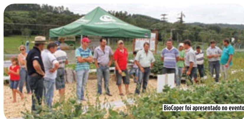
BioCoper foi apresentado no evento