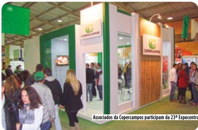
Associados da Copercampos participam da 23ª ExpoCentro

te nesta grande festa, recepcionando produtores, clientes e associados que prestigiaram o evento, assim como demonstrar um pouco do trabalho realizado pela Copercampos no município de Curitiba.