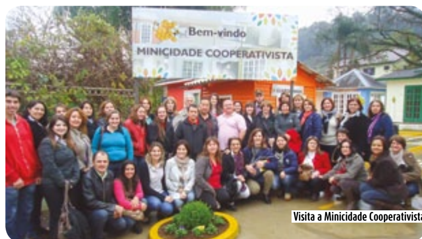
Visita a Minicidade Cooperativista