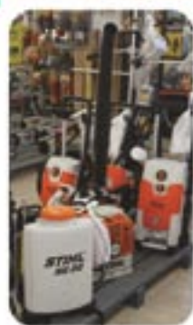
Aparador de grama, Sopradores e Cortador de grama Stihl

Lona para vedação de Silo de 150 e 200 micras pelos menores preços E ainda: Inoculantes para silagem Bio Max Milho em oferta!