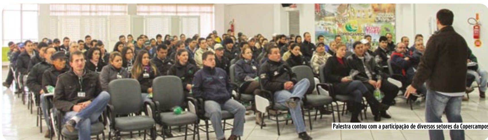
Palestra contou com a participação de diversos setores da Copercampos