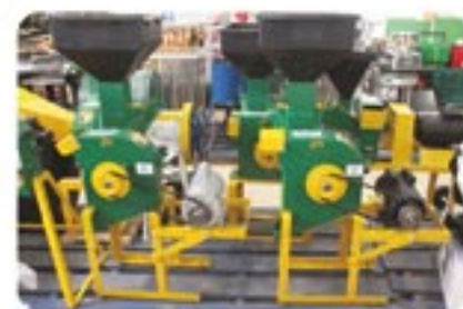
Toda linha de fornageiras Maqtron

Para consulta de preços e prazos, visite uma de nossas lojas e confira todos estes produtos e muitos outros.