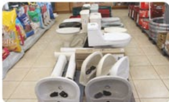
Toda linha de louças e metais sanitários Deca e Eternit