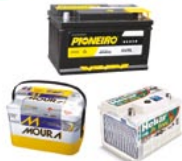
Baterias para carros, caminhões ou máquinas agrícolas das marcas: Pioneiro, Este, Heliar e Moura