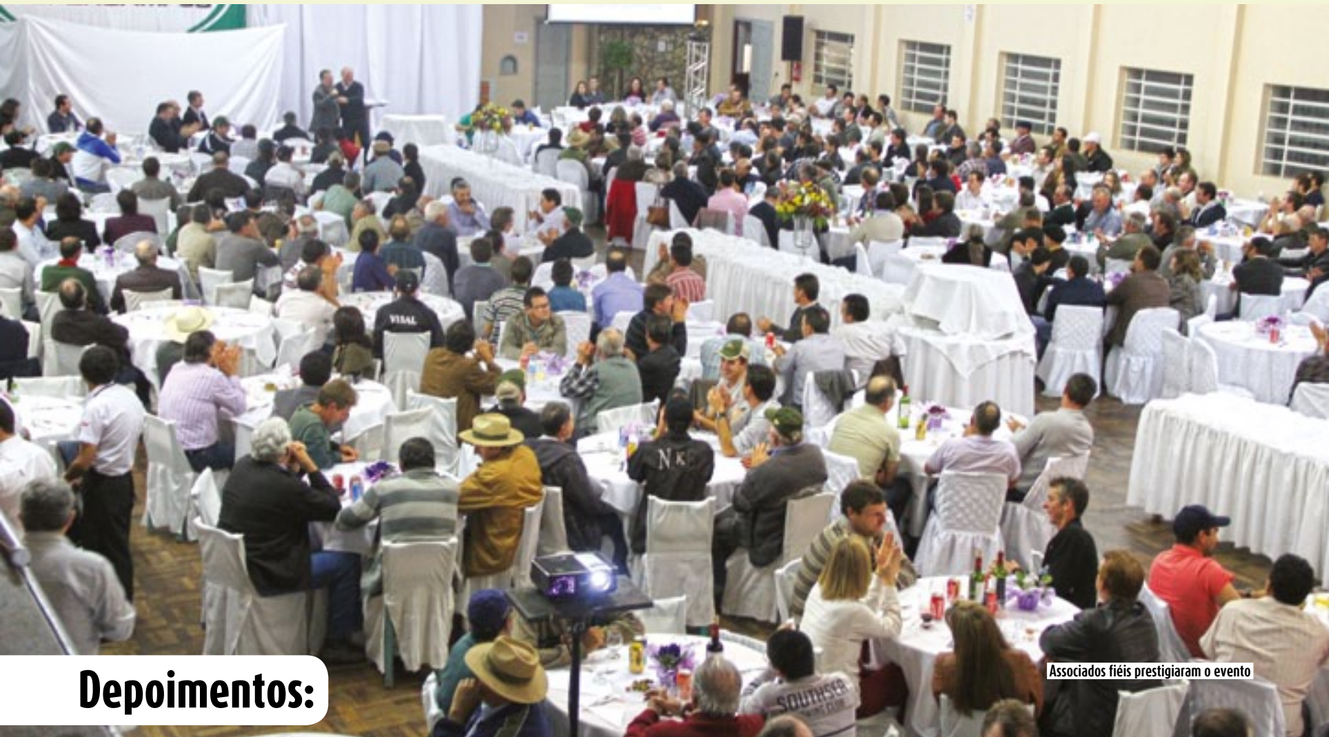
Associados fiéis prestigiaram o evento