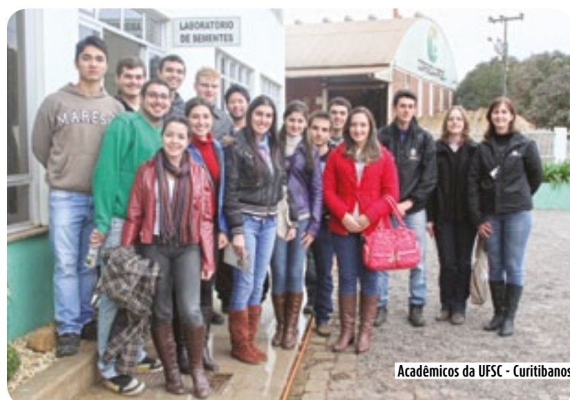
Acadêmicos da UFSC - Curitibanos

Os alunos puderam ainda conhecer a UBS do Bairro Aparecida, onde acompanharam o moderno processo de beneficiamento de sementes utilizado pela unidade.