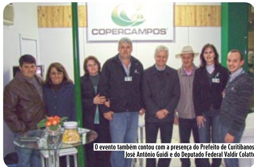
O evento também contou com a presença do Prefeito de Curitiba, José Antônio Guidi e do Deputado Federal Valdir Colatto