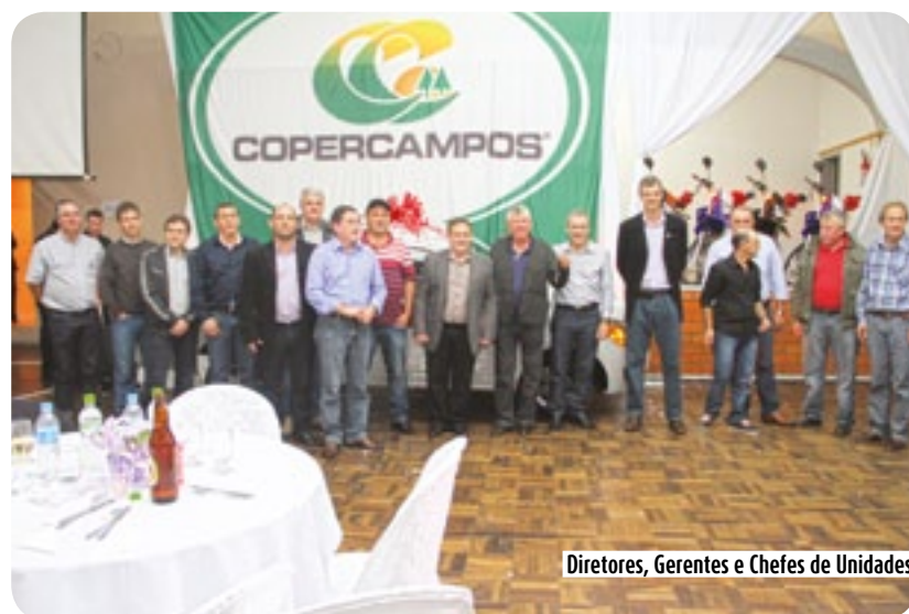
Diretores, Gerentes e Chefes de Unidades