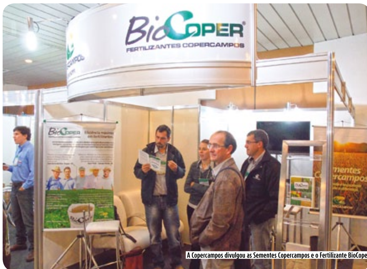
A Copercampos divulgou as Sementes Copercampos e o Fertilizante BioCoper

Responsáveis técnicos da Copercampos estiveram participando do XXII Ciclo de Reuniões Conjuntas da Comissão de Sementes e Mudanças do Paraná. O evento que foi realizado de 25 a 27 de junho em Foz do Iguaçu /PR reuniu profissionais envolvidos com o Setor Sementeiro, nas áreas de comercialização, produção, pesquisa e fiscalização de sementes e mudas.