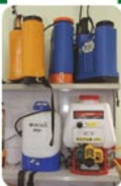
Pulverizadores costais a motor e manuais