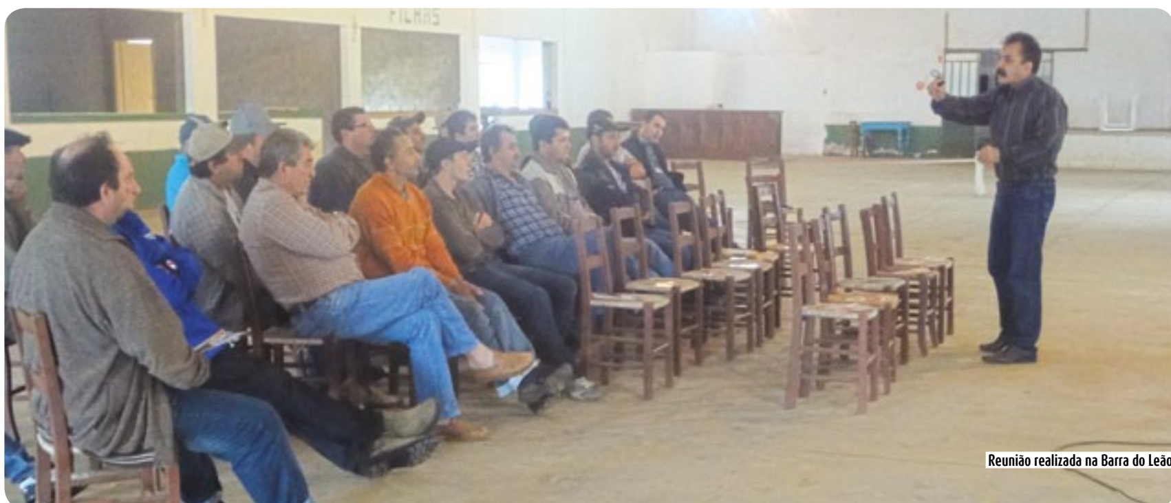
Reunião realizada na Barra do Leão