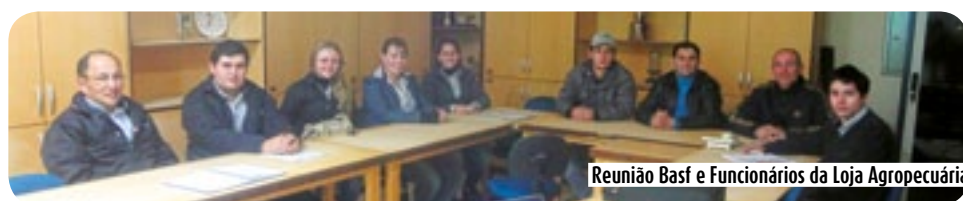
Reunião Basf e Funcionários da Loja Agropecuária

A Basf em parceria com a Copercampos realizou no dia 3 de julho na sala de reuniões do Departamento Técnico, uma palestra para os funcionários da Loja Agropecuária de Campos Novos. Na oportunidade foram apresentados produtos e novas tecnologias que irão auxiliar os funcionários no atendimento e venda dos produtos da Loja Agropecuária.