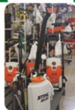
Roçadeiras, Pulverizadores, Lava Jato Stihl