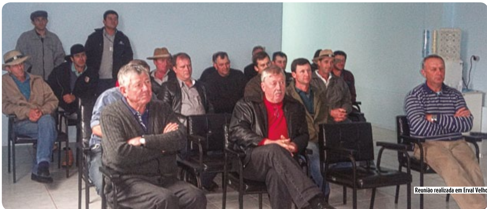
Reunião realizada em Erval Velho

Segundo a equipe técnica do Departamento de Suinocultura da Copercampos, as palestras fazem parte do programa de Rastreabilidade Suína que está sendo implantado na Copercampos. O objetivo é atingir 100% dos produtores da Integração.