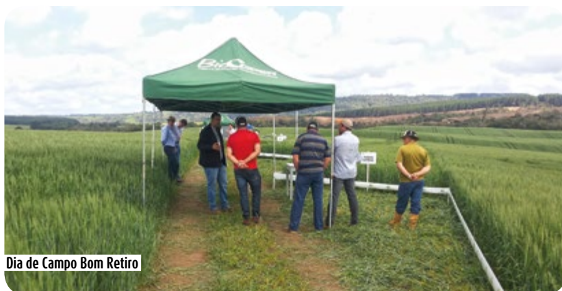
Dia de Campo Bom Retiro

O evento contou com a participação de 120 visitantes, incluindo a participação dos alunos da Universidade do Estado de Santa Catarina - UDESC. A Copercampos também realizou mais quatro Dias de Campo, nas regiões de Bom Retiro, Ituporanga, São José do Ouro e Witmarsun, onde os produtores puderam conferir os resultados obtidos e a adaptação das culturas de acordo com cada região.