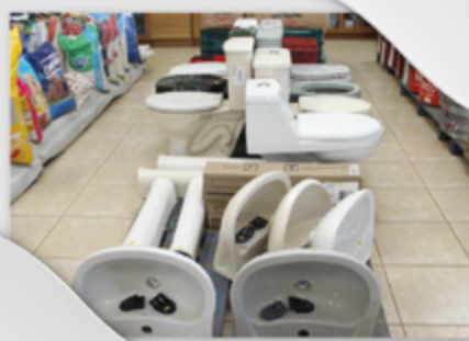
Toda linha de louças e metais sanitários Deca e Eternit

AS LOJAS AGROPECUÁRIAS COPERCAMPOS TEM A SUA DISPOSIÇÃO: