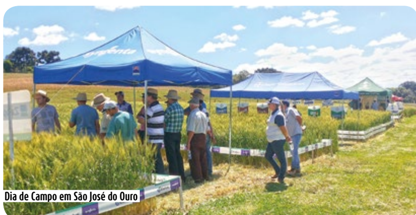
Dia de Campo em São José do Ouro