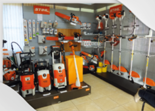
Linha completa de produtos Stihl