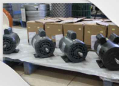
Motores Monofásicos 2 Polos Motores Monofásicos 4 Polos ¾ CV ½ CV 1 CV 2 CV e 3CV

Lona para vedação de Silo de 150 e 200 micras pelos menores preços E ainda: Inoculantes para silagem Bio Max Milho em oferta!