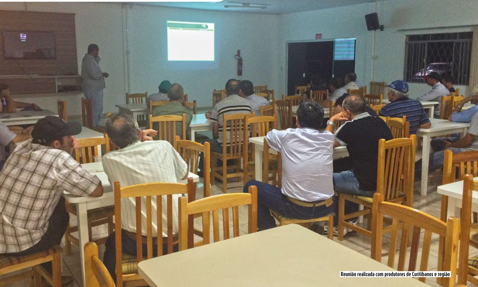
Reunião realizada com produtores de Curitiba e região

A ocorrência do Carrapichão já prejudica a comercialização e exportação de soja de produtores da região. O Carrapichão - Xanthium strumarium L. - é uma planta daninha invasora de pastagens e culturas anuais como soja e outras. De acordo com o Departamento Técnico da Copercampos, na última safra, cargas de soja que já estavam prestes a serem exportadas tiveram que retornar para suas unidades devido a presença de sementes da planta daninha.