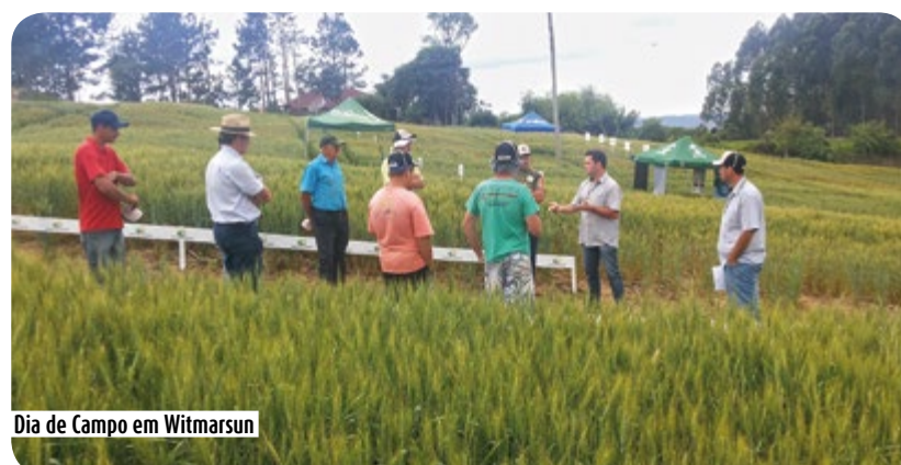
Dia de Campo em Witmarsun