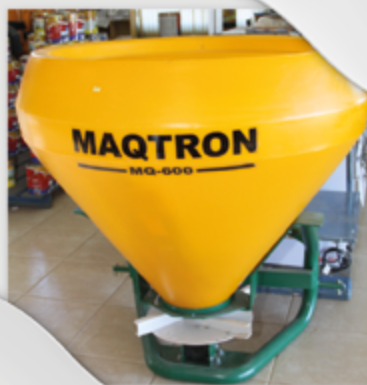
Distribuidor de Sementes e Insumos. Capacidade 600kg