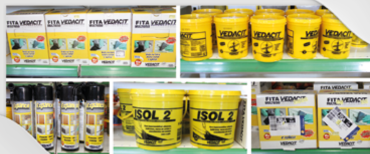
Vedação para paredes e telhados

Para consulta de preços e prazos, visite uma de nossas lojas e confira todos estes produtos e muitos outros.