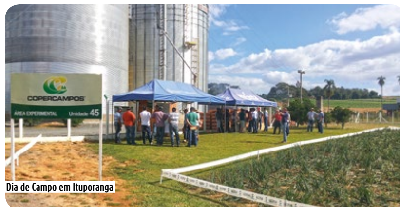
Dia de Campo em Ituporanga