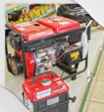
Gerador, Soldador e Compressor de ar